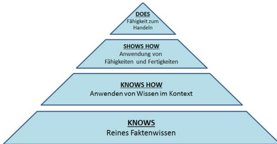
Abbildung 3: Miller-Pyramide der Lerntiefe [24], [25]

Die in den Arbeitspaketen aufgeführten Kompetenzen, Teilkompetenzen und Lernziele können den Ebenen der Miller-Pyramide zugeteilt werden [24]. Hiermit wird die Lerntiefe der Kompetenzen wiedergegeben [1].