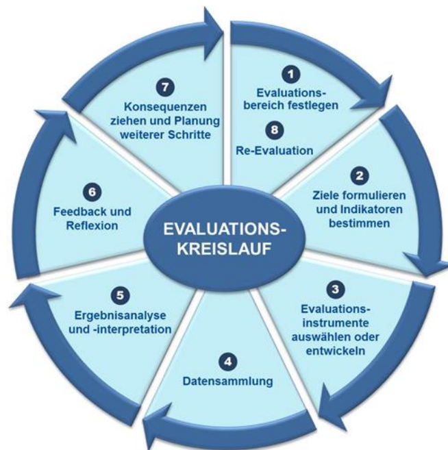
Abbildung 4: Kreislauf der wiederkehrenden Schritte einer Evaluation

Evaluation kann als sich wiederholender Kreislauf gedacht werden. Maßnahmen, die infolge vorangegangener Evaluationen ergriffen wurden, sollten immer reevaluiert werden.